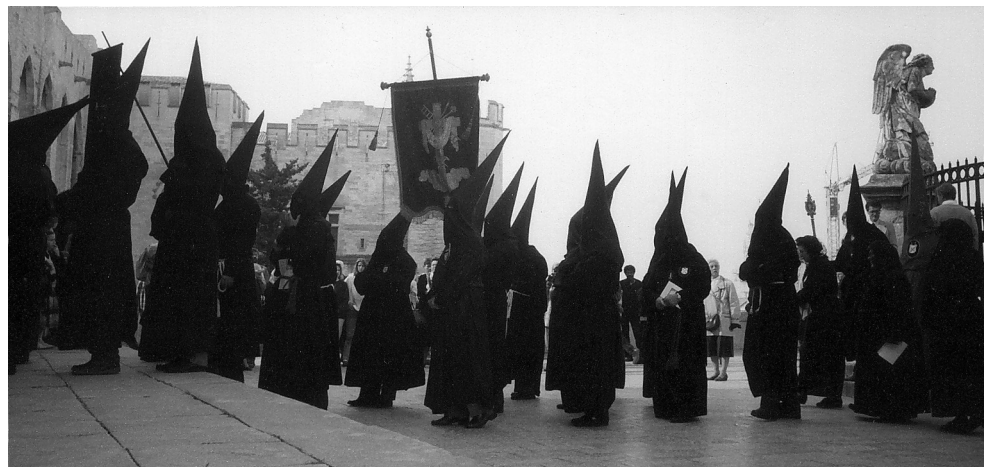
Basilique d'Avignon, 1990, Grande maintenance des pénitents

C'est ainsi que Roche et Guérin, médecins de l'Hôpital Général d'Avignon, approuvaient sans réserve l'ouvrage anonyme publié en 1813, à compte d'auteur, traitant de « La Science de la Santé soit pour le moral soit pour le physique ».